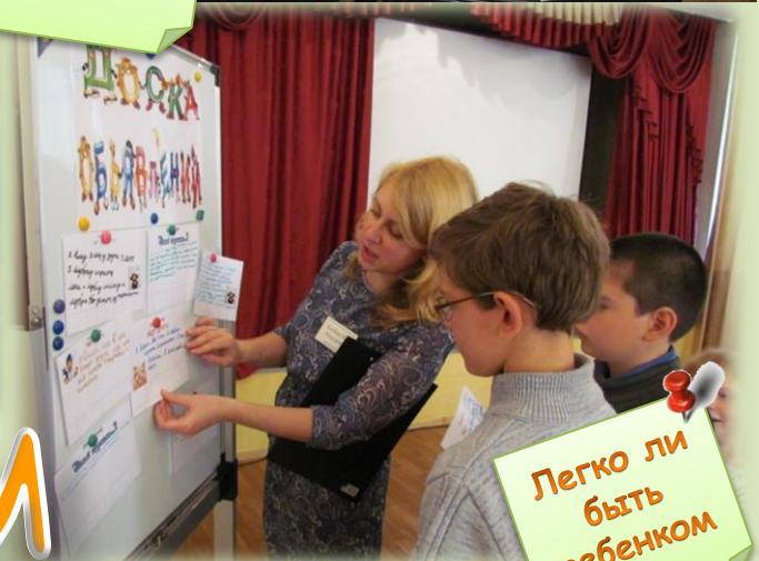
Легко ли быть ребенком