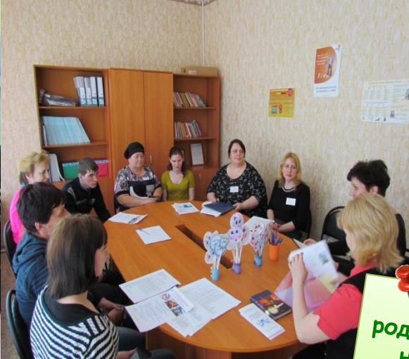
Бюро родительских находок