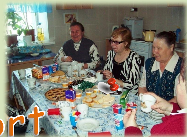
Групповое и индивидуальное консультирование